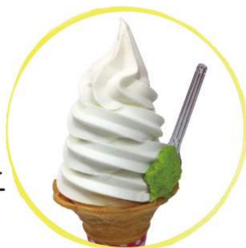
本わさびソフトクリーム 370円(税込)

すりおろした本わさびの辛味 とソフトクリームの甘さが絶 妙! (門前せせらぎ店)