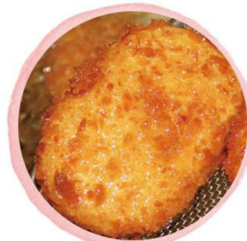
みしまコロッケ 150円(税込)

すりおろした本わさびの辛味 とソフトクリームの甘さが絶 妙! (門前せせらぎ店)