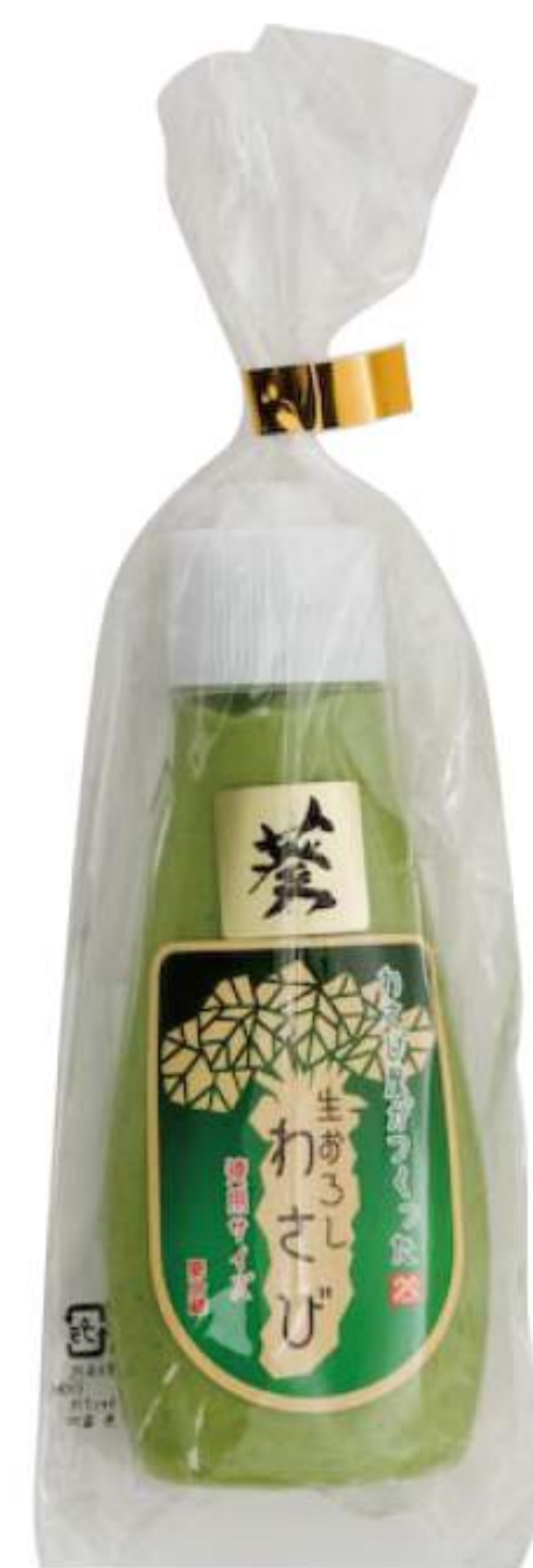
生おろしわさび（大） 890円