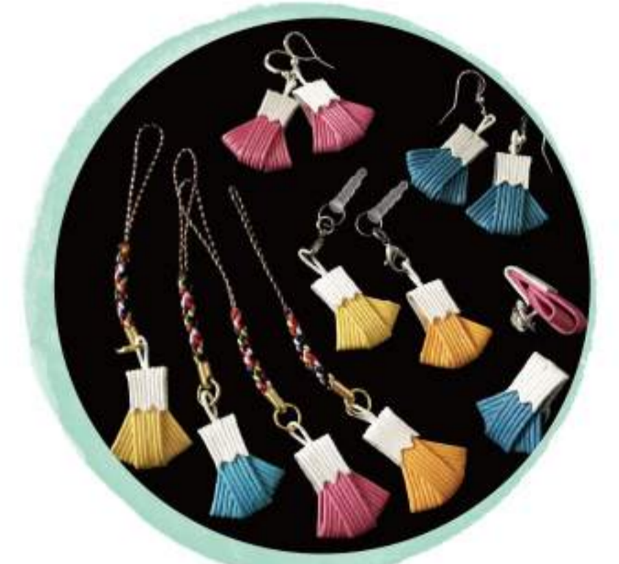
紙ひもペーパークラフト 富士山/480円(税込)

三島のB級グルメ「みしまコ ロッケ」は、しっとりクリー ミー。(ころっけスタンド薬庵 (ひこばえあん))