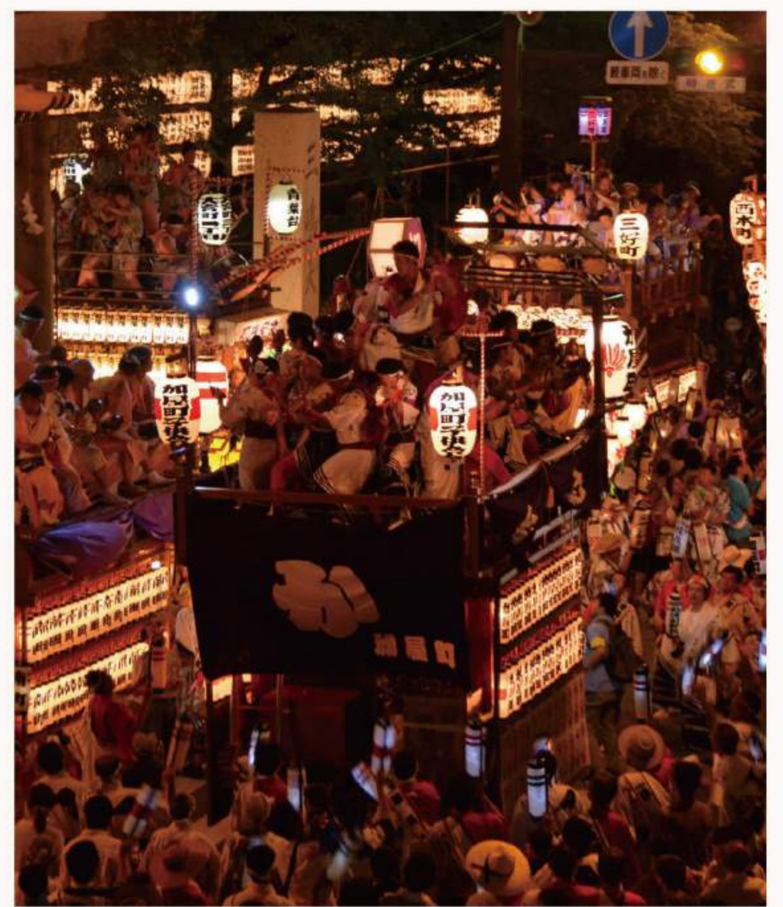
三島夏まつり 8/15~17 開催 詳細は三島市役所ホームページへ